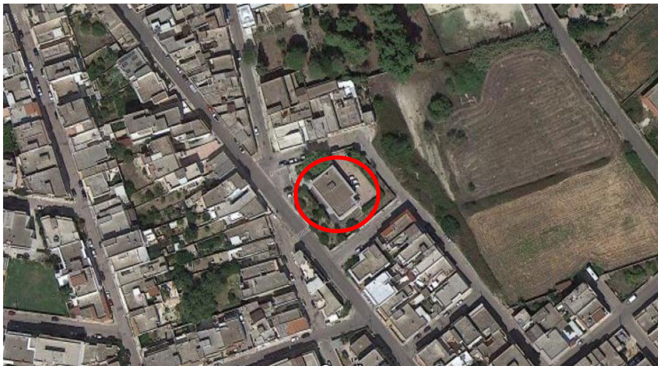
Figura 1: Aerofotogrammetrico Comune di Casarano con individuazione del corpo di fabbrica in via Piave 68

L'intervento oggetto del presente documento si colloca nel corpo di fabbrica ubicato nel comune di Casarano, in via Piave n.68 attualmente occupato dal servizio Veterinari dell'ASL di Lecce. Tale edificio è ubicato in zona meridionale del comune di Casarano (LE) ed è insediato su un'area di proprietà dell'Azienda Sanitaria Locale di Lecce.