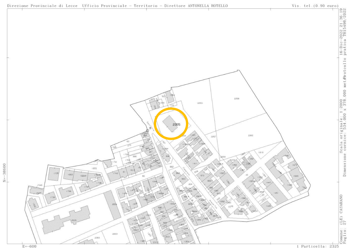
Figura 2: Estratto di scheda catastale